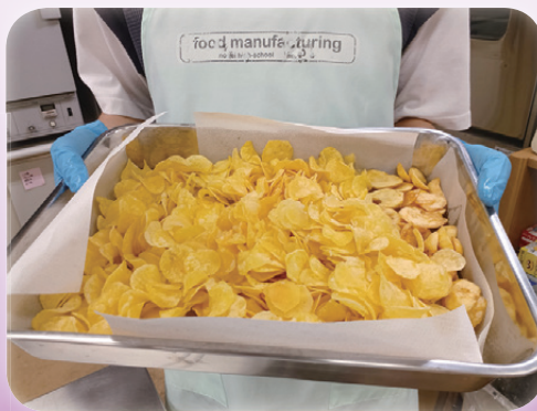
ポテトチップスの製造