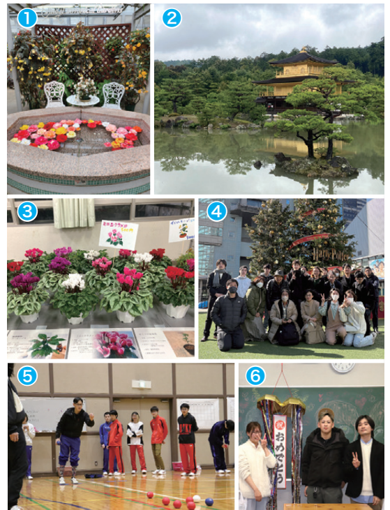
① 校外学習 ② 修学旅行 ③ 農芸祭での販売 ④ 芸術鑑賞教室 ⑤ スポーツ大会 ⑥ 送別会