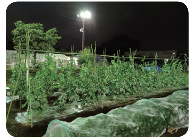
ライトアップされた農場