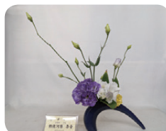
「園芸デザイン」の実習作品 (本校4年次)

東京都立農芸高等学校 (定時制) は主に農業、園芸、食品製造について学べる高校です。農業、園芸では特に作物や植物という「命」を扱う授業でしたので、命というものを自然と実践的に学ぶことができました。