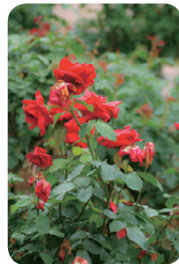
バラの撮影 (本校4年次)

私は農芸高校で、栽培の大変さ、販売の喜び加工の楽しさを学びました。栽培では細かい部分の調整に苦労しましたが、収穫できた時には大きな達成感がありました。販売では、自分たちが収穫したものが実際に販売され、嬉しかったです。加工では、自分たちが作り上げたものを美味しく調理することが出来、栽培して良かったと感じることが出来ました。