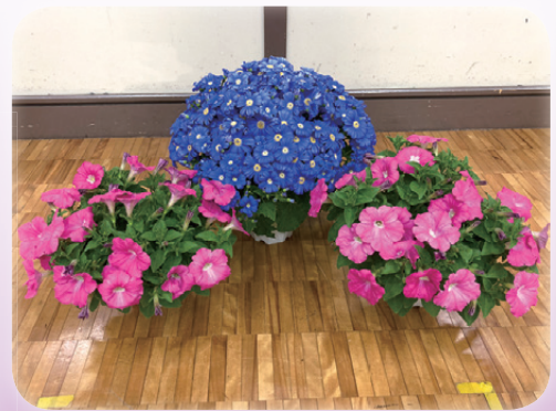
卒業式の鉢花装飾