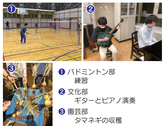
① バドミントン部 練習 ② 文化部 ギターとピアノ演奏 ③ 園芸部 タマネギの収穫