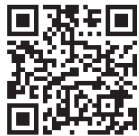
学校ホームページ